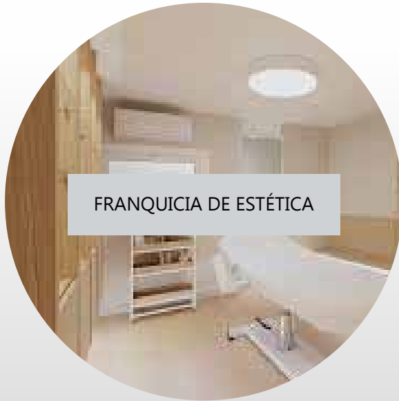
FRANQUICIA DE ESTÉTICA