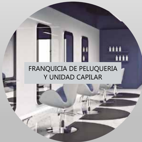
FRANQUICIA DE PELUQUERÍA Y UNIDAD CAPILAR