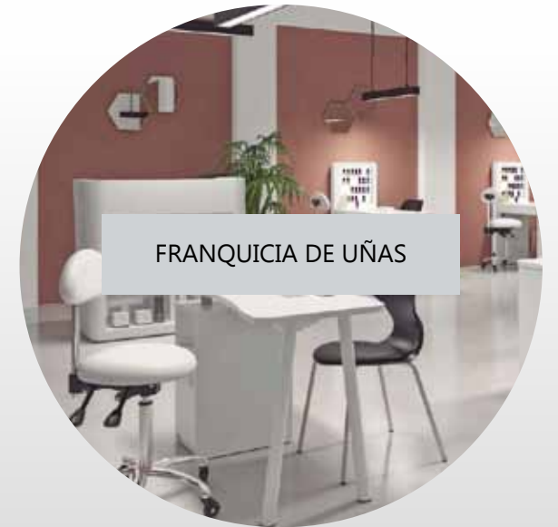
FRANQUICIA DE UÑAS

5 modelos de negocio que se adaptan a las necesidades de cualquier emprendedor.