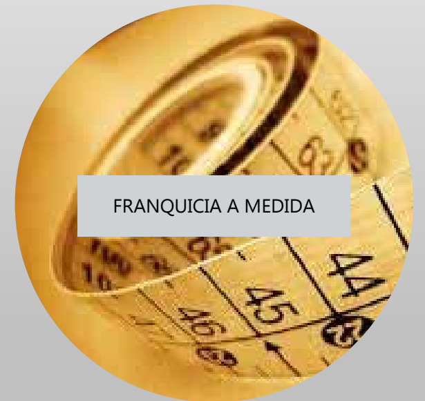
FRANQUICIA A MEDIDA