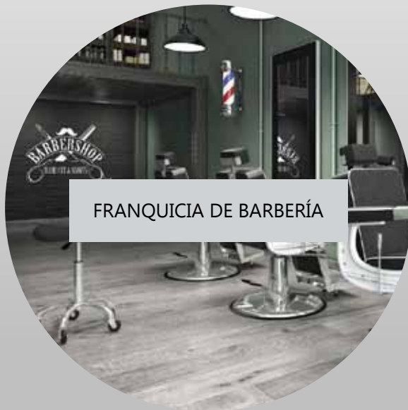
FRANQUICIA DE BARBERÍA